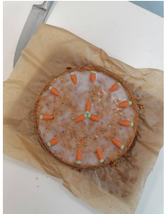
Geburtstagskuchen (ein Beispiel)