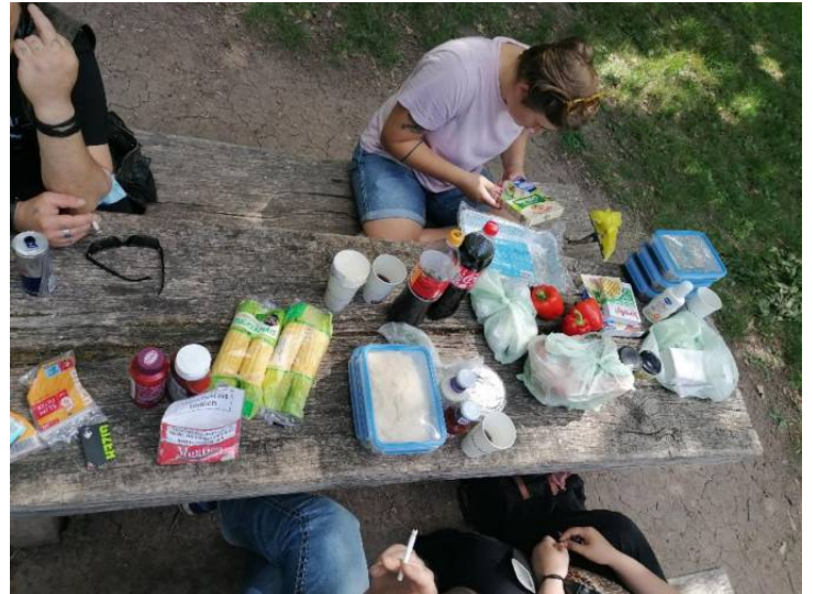
Grill-Ausflug zum Wildgehege Entringen