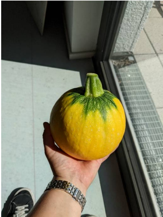
Unsere erste Zucchini aus dem Haus eigenen Hochbeet