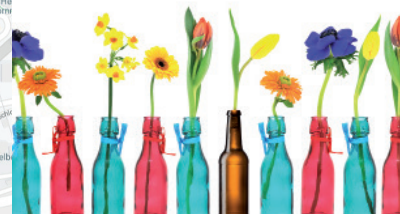
Stand: Dez 2020

Fachstelle Sucht Heidelberg Unterer Fauler Pelz 1 69117 Heidelberg Telefon: 06221/23432 Fax: 06221/23446 Email: fs-heidelberg@bw-lv.de