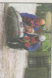
Dauerregen im Norden Tief »Alfred« sorgt für einen Ausnahmezustand. ► Aus aller Welt