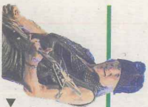
Markenzeichen Gitarrenriffs Michael Schenker und Co. wollen das Freilichttheater in Colmar rocken. ► Ausblick Wochenende

UNABHÄNGIGE TAGESZEITUNG AMTSBLATT FÜR DEN KREIS CALW FÜR BADEN-WÜRTTEMBERG NAGOLDER TAGBLATT