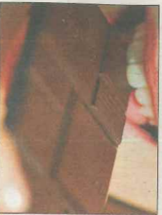
Naschen bleibt folgenlos.

Heidelberg. Im Prozess vor dem Arbeitsgericht in Heidelberg stimmten beide Seiten einem Vergleich zu. Die frist-