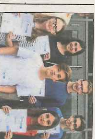
Starkes Engagement Sechs Sozialpreise hat das OHG am letzten Schultag vergeben. ► Nagold

Ausgabe C1 | 183. Jahrgang | Nummer 171 | E 6234 A